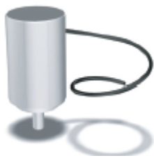
Pamje per orientim e pjeseve

Keto duhen per te zevendesuar pjeset e nderimit te gjeneratorit te azotit qe rekomandohet nga manuali ‘Preventative Maintenance Guide’ Te cilat kane keto te dhena teknike si me poshte: