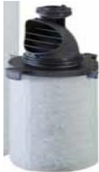
Pamje per orjentim e pjeses

Kjo pjese duhet per te zvendesuar pjesen e nderimit te gjeneratorit te azotit e cila ka keto te dhena teknike si me poshte: